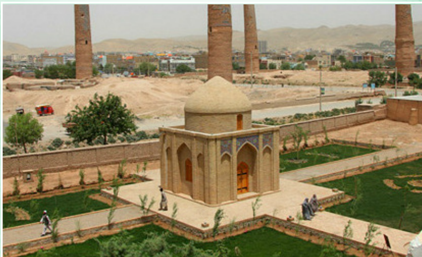
Alisher Navoiy maqbarasi (Hirot)